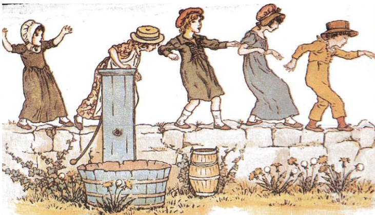
Följa John. Målning av Kate Greenway.

katten med sitt uppdrag blir katten rått och en ny person blir katt.