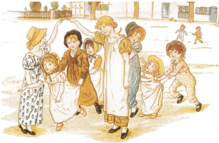
Bro bro breja. Målning av Kate Greenway.