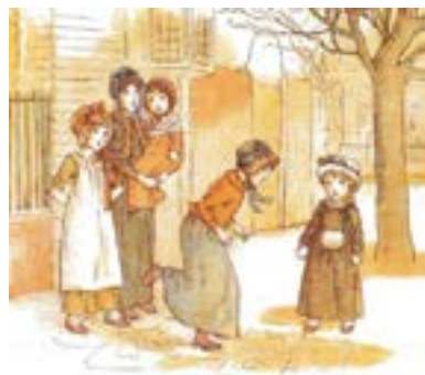
Hoppa hage. Målning av Kate Greenaway.

Hoppa hage är en av de äldsta barnlekarna i Europa. Till de allmänna reglerna hör, att man inte får trampa på linjerna eller sätta ned någon fot i fel ruta. Alla hagar kan hoppas på olika sätt. Det är ni som leker som bestämmer reglerna.