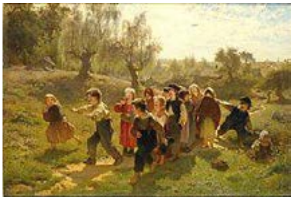
Sista paret ut. Målning av August Malmström.