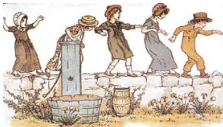
Följa John. Målning av Kate Greenway.

katten med sitt uppdrag blir katten råtta och en ny person blir katt.